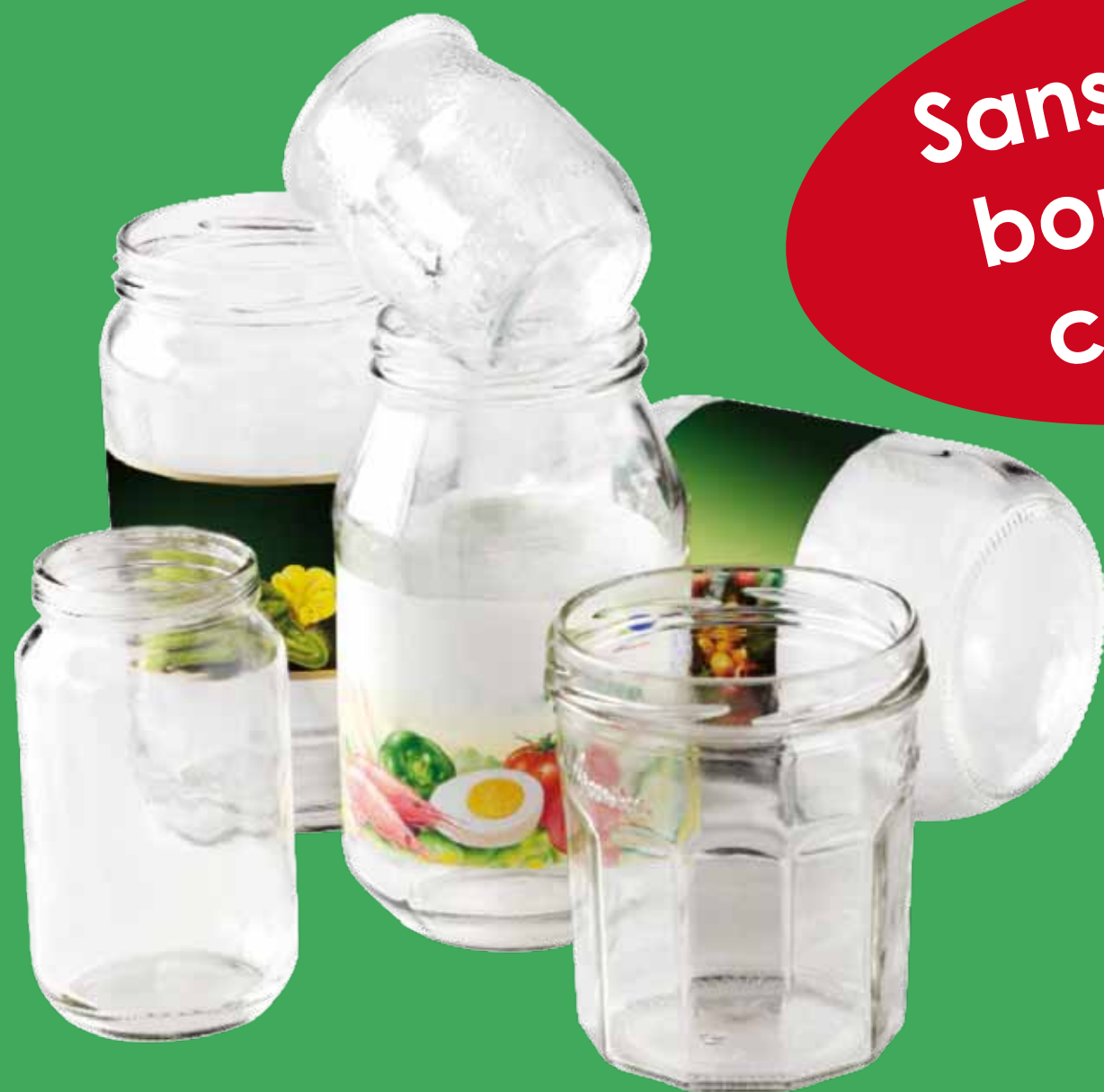
Bocaux en verre