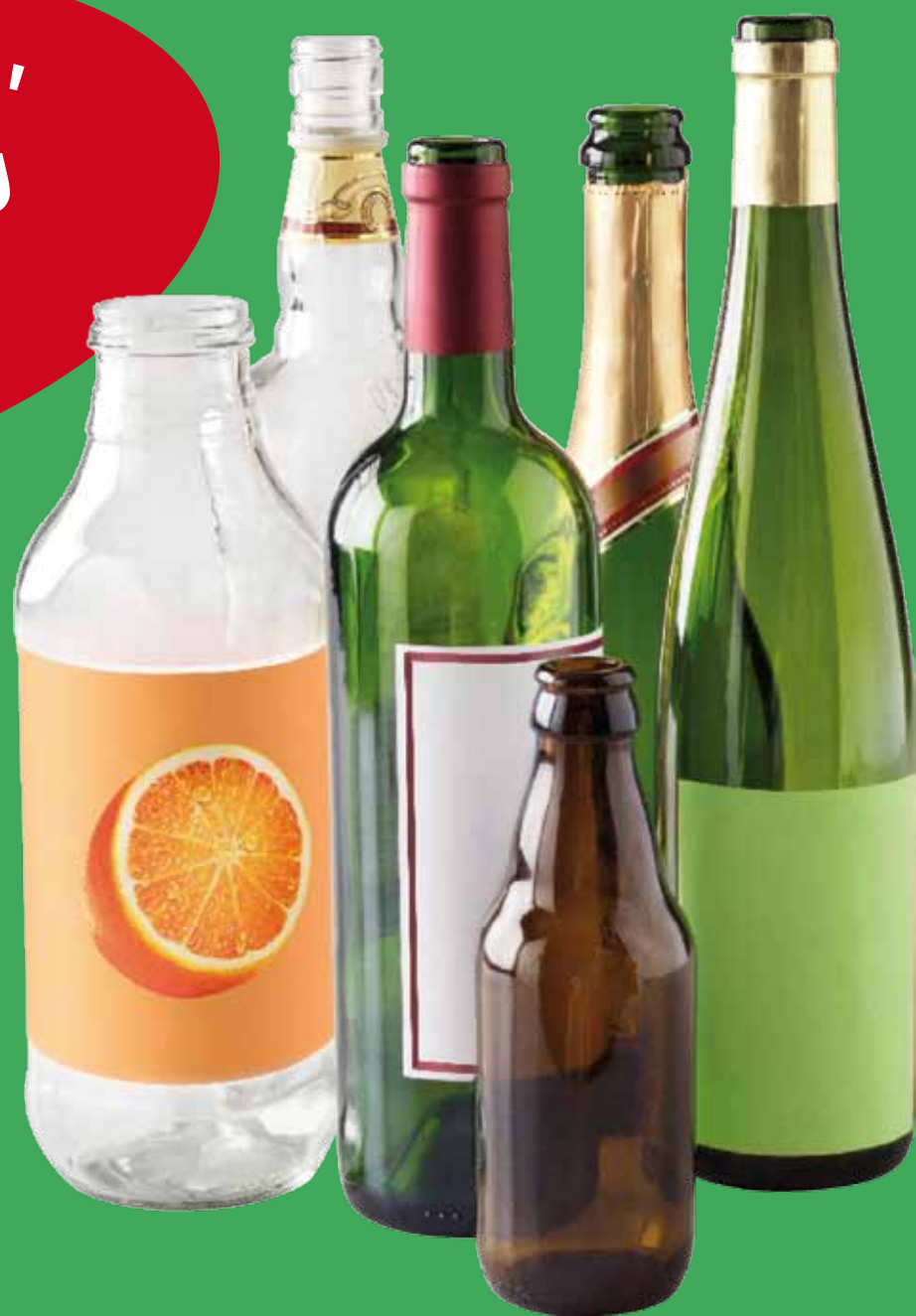
Bouteilles en verre